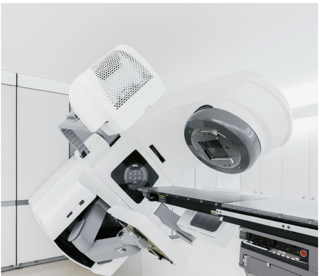
Linearbeschleuniger für die Strahlentherapie

Doch das ist nur eines von vielen Beispielen für die Arbeit des Strahlenschutz-Dezernats. Die Mitarbeiterinnen und Mitarbeiter prüfen, genehmigen und überwachen nahezu alle Tätigkeiten im Zusammenhang mit ionisierender Strahlung in Industrie, Forschung, Lehre und Medizin. Da-