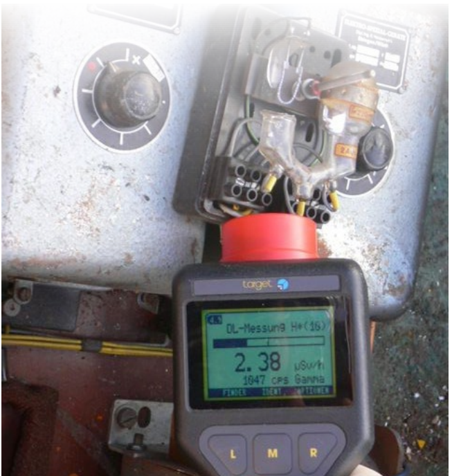
Messung der Strahlung eines Quecksilberschalters

Die Beschäftigten des Regierungspräsidiums sind beispielsweise gefragt, wenn eine Genehmigung zum Umgang mit offenen und umschlossenen radioaktiven Stoffen erteilt werden soll. Auch für den Betrieb von Röntgenanlagen sowie von Anlagen zur Erzeugung ionisierender Strahlung, zur Lagerung und Entsorgung radioaktiver Abfälle sowie für die Beförderung radioaktiver Stoffe sind Genehmigungen unter anderem nach dem Strahlenschutzgesetz erforderlich.